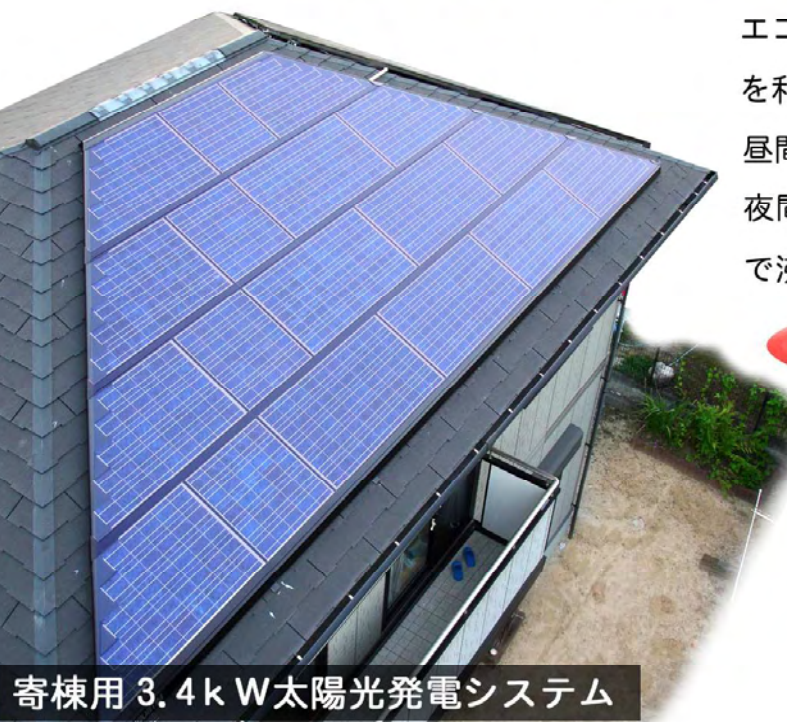
寄棟用 3.4 k W 太陽光発電システム