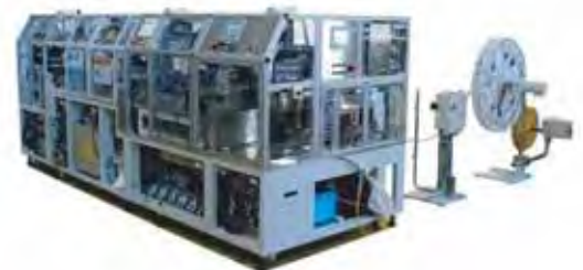
車載用部品組立装置

お問い合わせ等は、本社営業課、東京営業所、大阪営業所、熊本営業所、またはhsales@i-kk.co.jpまで。