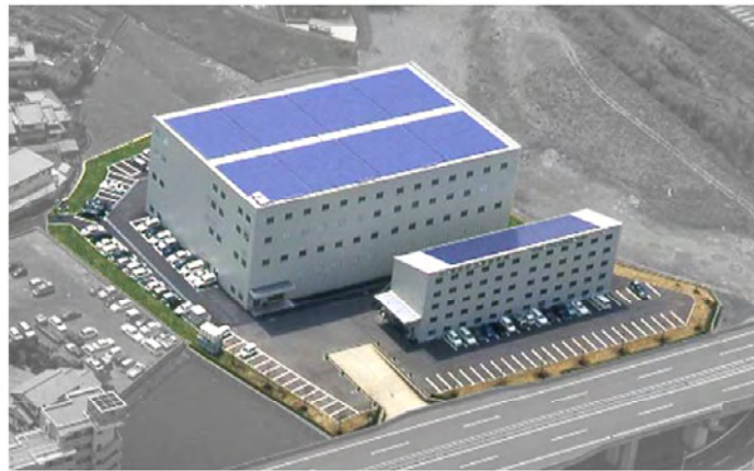
大分曲工場航空写真

県内 1 の規模を誇る 300 k W 太陽光発電システムを自社工場に設置しました。 (大分曲工場 1 号棟 250 k W、2 号棟 50 k W モジュール枚数 計 2,155 枚)