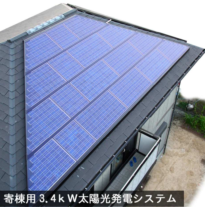
寄棟用 3.4 k W 太陽光発電システム