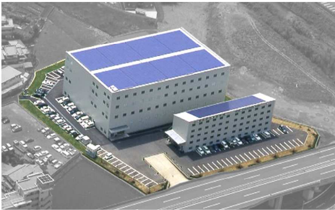
大分曲工場航空写真

県内 1 の規模を誇る 300 k W 太陽光発電システムを自社工場に設置しました。 (大分曲工場 1 号棟 250 k W、2 号棟 50 k W モジュール枚数 計 2, 155 枚)